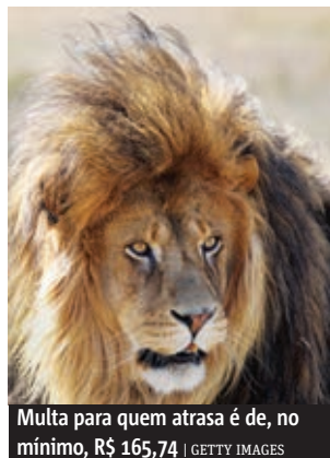
Multa para quem atrasa é de, no mínimo, R$ 165,74

O prazo para entregar a declaração do IR (Imposto de Renda) 2013 termina às 23h59min59s (horário de Brasília) de amanhã. Quem ainda não acertou as contas com o Leão corre o risco de enfrentar dificuldades por causa do grande número de acessos, que pode deixar o site lento.